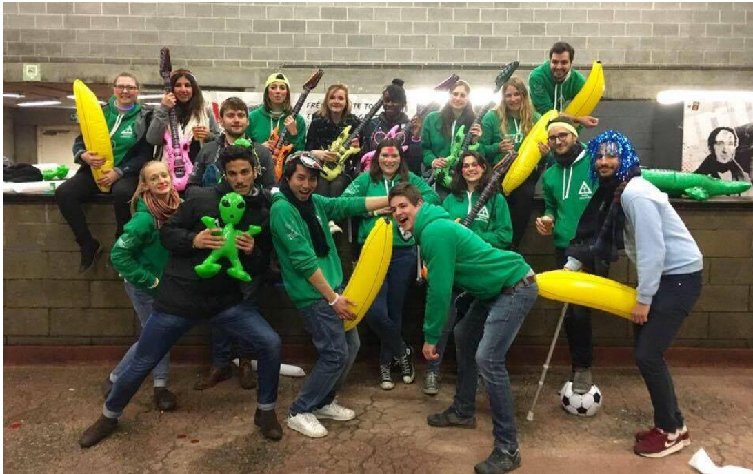
Notre comité chéri au dernier TD pharma