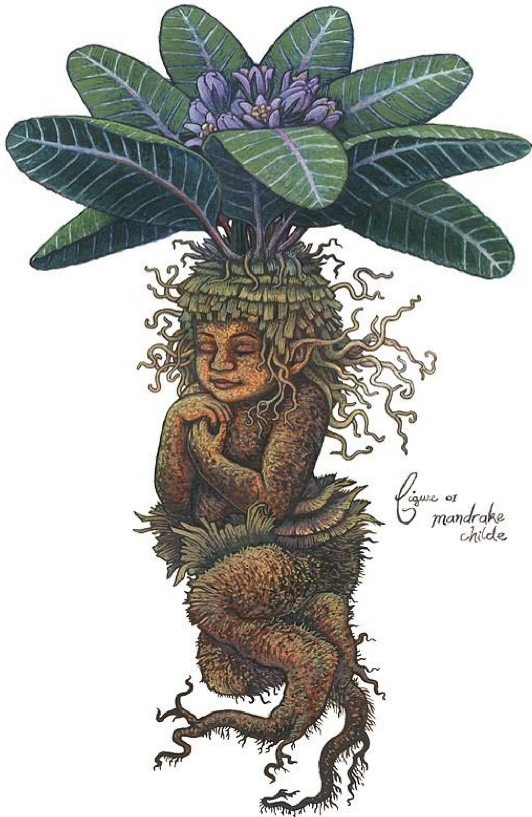
Figure of mandrake childe